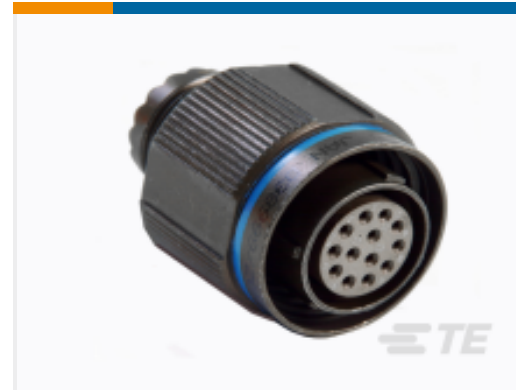
TE 产品编号YDTS26F13-98SNV001 PLUG ASSY