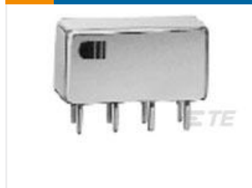
TE 产品编号2-1617031-0 HFW1201K45 = M39016/6-109L