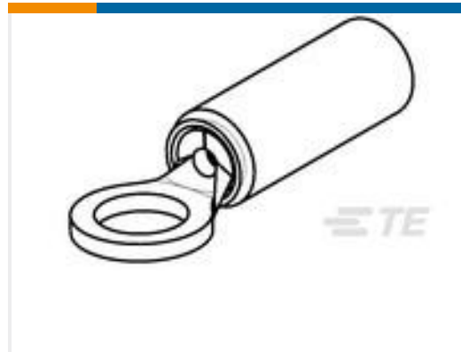
TE 产品编号 1577625-1 TERMINAL RT PIDG PEEK STRATO 20 AWG