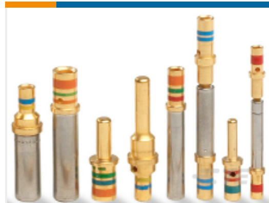
TE 产品编号 ZPF0000000000000358 006-0937-12 A