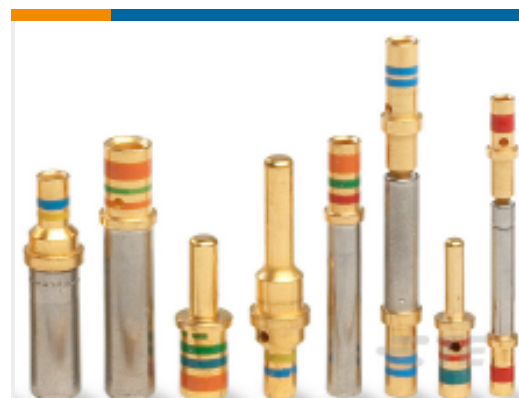
TE 产品编号 ZPF0000000000000362 006-0937-16 A