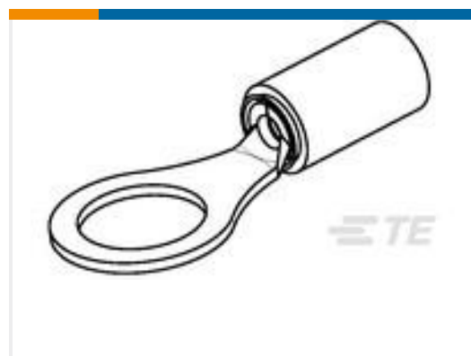
TE 产品编号 1577642-1 TERMINAL RT PIDG PEEK STRATO 14- 12 AWG