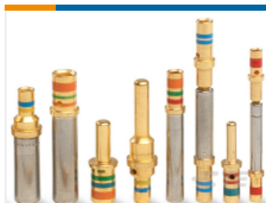
TE 产品编号 ZPF0000000000000568 020-0511-12