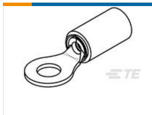
TE 产品编号 1577639-1 TERMINAL RT PIDG PEEK STRATO 14- 12 AWG