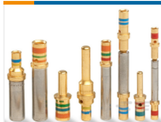
TE 产品编号 ZPF0000000000000335 006-0912-12 A