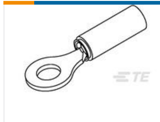
TE 产品编号 1577619-1 TERMINAL RT PIDG PEEK STRATO 24- 22 AWG