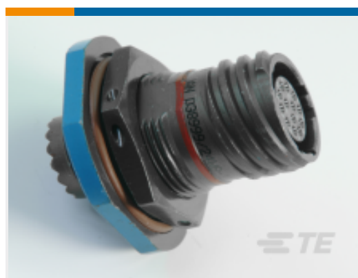
TE 产品编号 CAT-D38999-DTS10I D38999: Jam Nut, 17-35 Insert, Electroless Nickel Plating