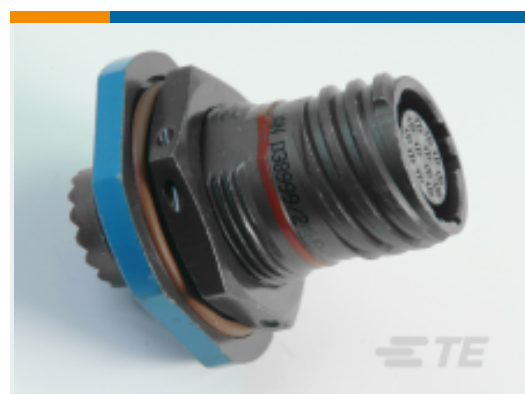
TE 产品编号 CAT-D38999-DTS10H D38999: Jam Nut, 17-26 Insert, Electroless Nickel Plating