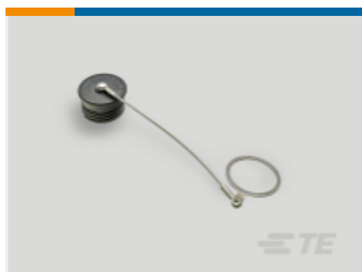
TE 产品编号 YDTS32F17NV0010000 DUST COVER ASSEM