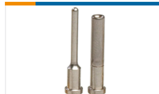
TE 产品编号ZPF0000000000001261 097-0267-16 A1267