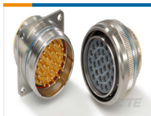
TE 产品编号ZPF00000000000007174 983-0RS 08-98 PN