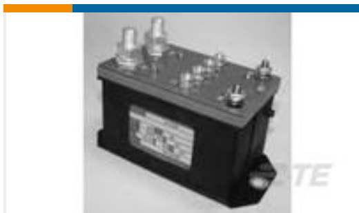
TE 产品编号1616058-6 A703CD (FAA/PMA)=RELAY