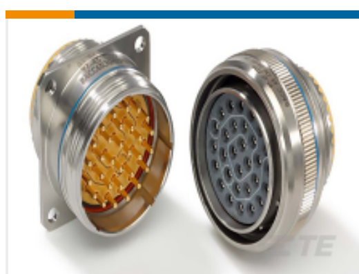
TE 产品编号ZPF00000000000007174 983-ORS 08-98 PN