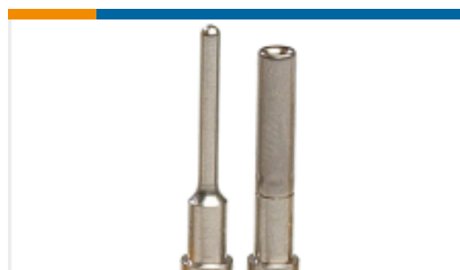
TE 产品编号ZPF0000000000001261 097-0267-16 A1267