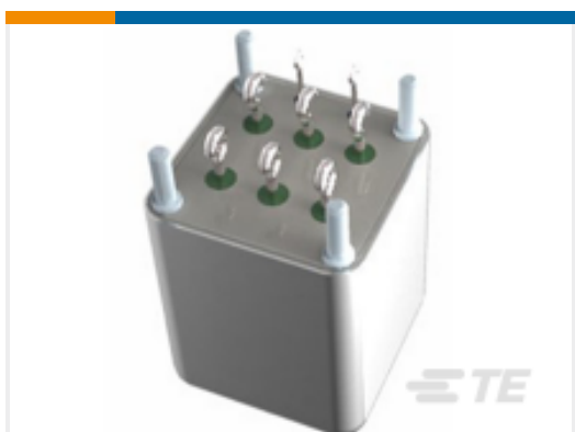
TE 产品编号4-1617806-6 FC-325-7=MS27418-1D