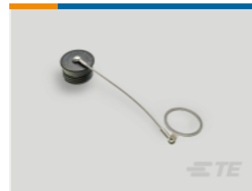
TE 产品编号 YDTS32F11NV0010000 DUST COVER ASSEM