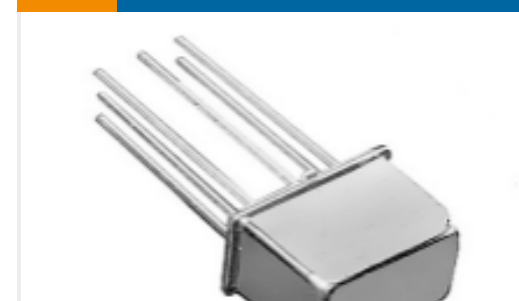
TE 产品编号1617147-5 JMGAP-26P = M39016/17-030P