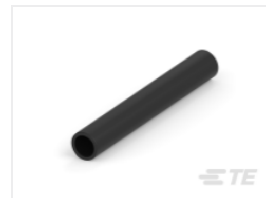
TE 产品编号 CAT-HST-BSTS BSTS/BSTS-FR 热缩管