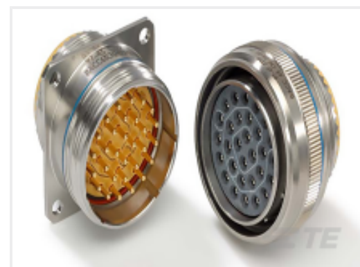
TE 产品编号 ZPF0000000000007174 983-0RS 08-98 PN