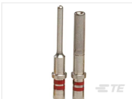
TE 产品编号 ZPF0000000000001261 097-0267-16 A1267