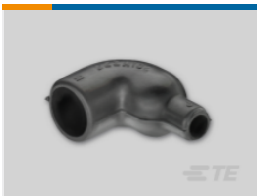
TE 产品编号903960-000 球形热缩护套：有嘴，直角