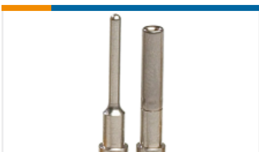
TE 产品编号ZPF0000000000001261 097-0267-16 A1267