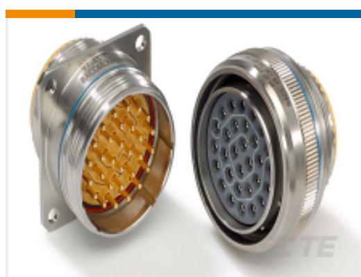
TE 产品编号ZPF00000000000007174 983-ORS 08-98 PN