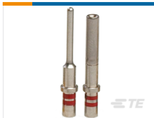
TE 产品编号ZPF0000000000001261 097-0267-16 A1267