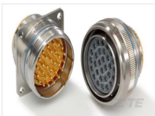
TE 产品编号 ZPF0000000000007174 983-ORS 08-98 PN