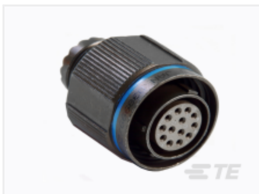
TE 产品编号 YDTS26Z11-99PAV001 PLUG ASSY