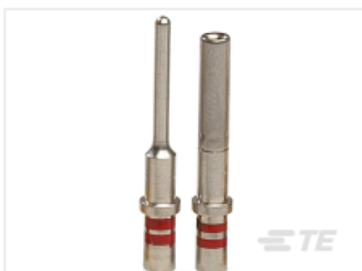
TE 产品编号 ZPF000000000001261 097-0267-16 A1267