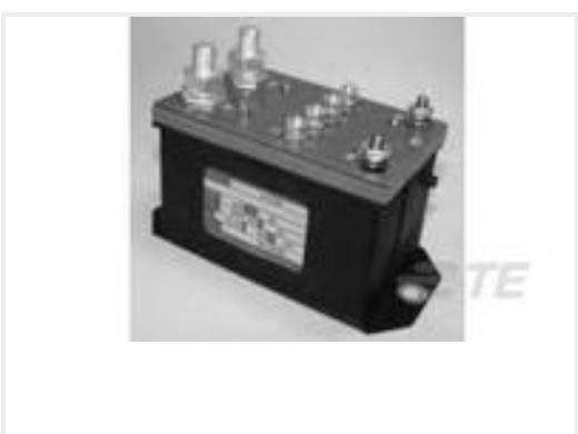
TE 产品编号 1616058-6 A703CD (FAA/PMA)=RELAY