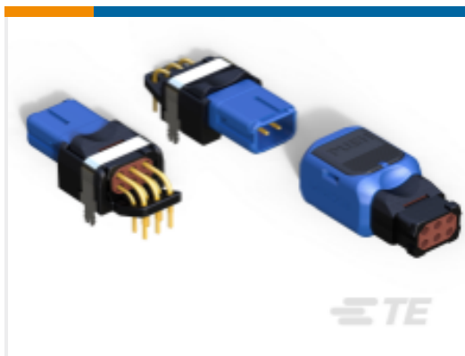
TE 产品编号 YD369-G99-NP400000 369 9 WAY INLINE 90 PCB REC, GOLD, PIN