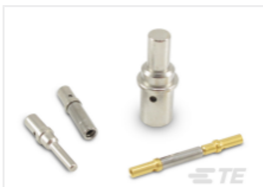
TE 产品编号CAT-D48-ST273 DEUTSCH Solid Contacts