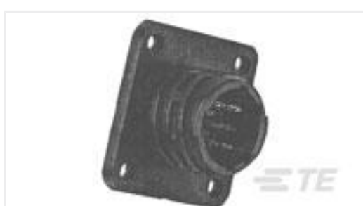
TE 产品编号205843-1 CPC RECPT ASSEMBLY SIZE 23-63