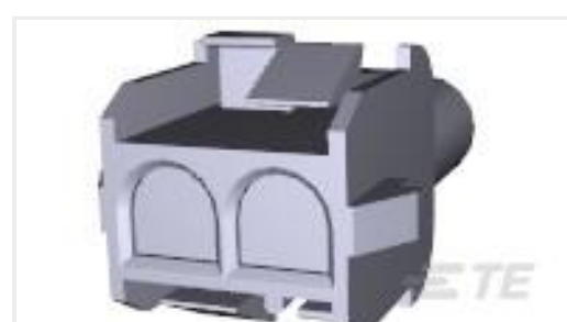
TE 产品编号1-480699-0 02P UMNL CAP HSG NATL