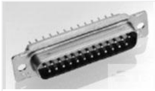
TE 产品编号205558-2 AMPLIMITE,ASY,PLUG,STD,109,2