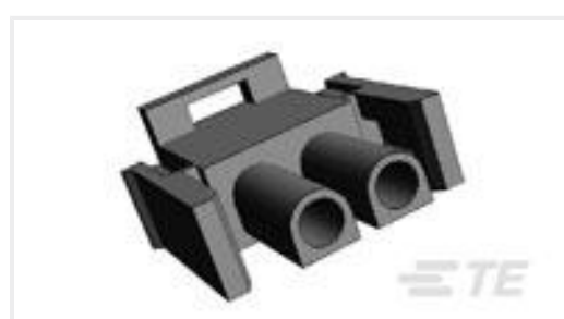
TE 产品编号1-480698-0 02P UMNL PLUG HSG NATL