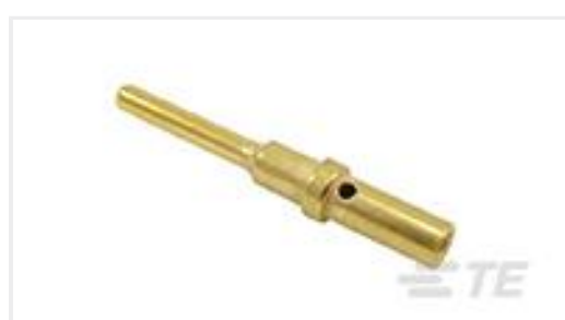
TE 产品编号0460-202-1631 PIN, SOLID, SIZE 16, 16-20AWG, AU