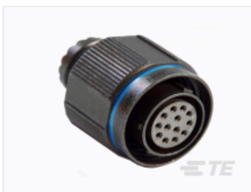
TE 产品编号 YDTS26W25-19SAV001 PLUG ASSY