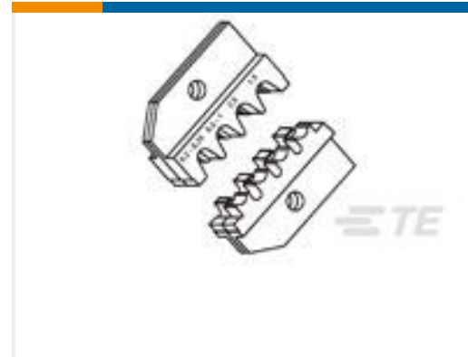
TE 产品编号 539654-2 MATRIZE .250 FF