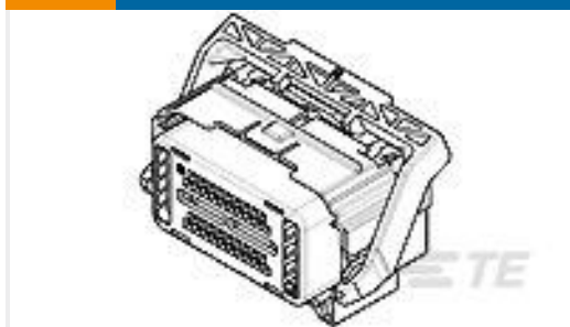
TE 产品编号 1438082-2 46 WAY KEY B HARNESS PLUG ASSY