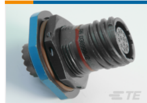
TE 产品编号YDTS24W2544420PN04 RECEPT.JAM NUT.HIGH CURRENT.