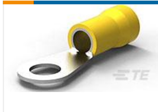
TE 产品编号52266-1 TERMINAL R PG 4 3/8