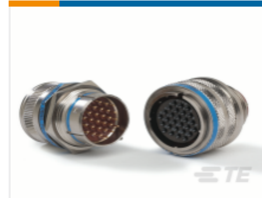
TE 产品编号ZPF000000000012524 DBAS 70-19-7 PN