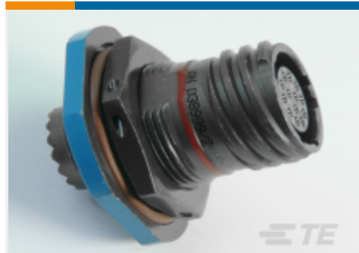
TE 产品编号YDTS24W17-35PNV001 RECP ASSY