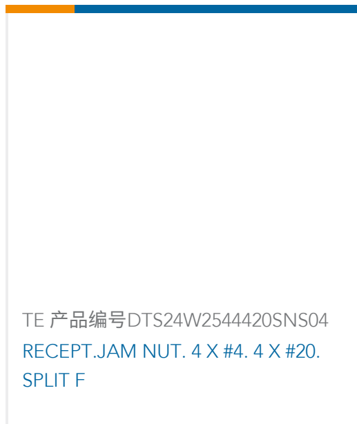
TE 产品编号DTS24W2544420SNS04 RECEPT.JAM NUT. 4 X #4. 4 X #20. SPLIT F