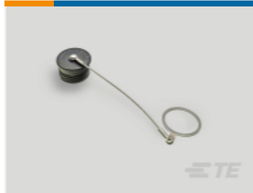
TE 产品编号YDTS32Z15NV0010000 CAP ASSEMBLY