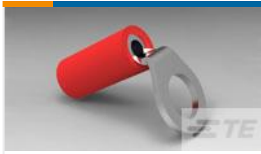
TE 产品编号55148-1 TERMINAL,PIDG R 22-16 10