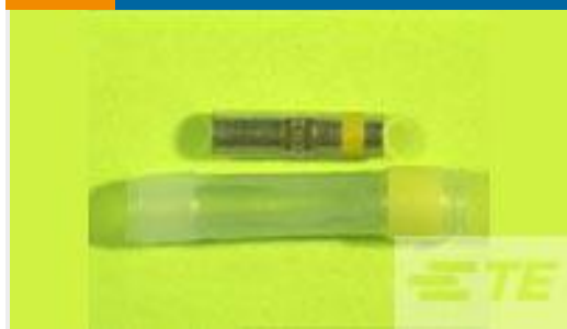
TE 产品编号650130-000 D-436-86