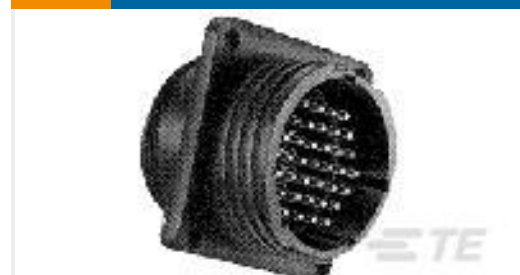
TE 产品编号208130-1 CPC RECPT ASSEMBLY SIZE 11-4