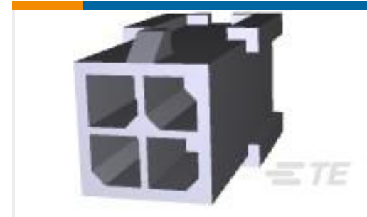
TE 产品编号794616-4 FREE HANG DBL ROW HSG 4 POS