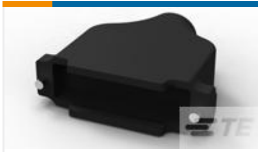
TE 产品编号5748677-3 PLTD PLST CBL CLMP KIT,SZ 3