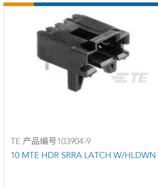
TE 产品编号103904-9 10 MTE HDR SRRA LATCH W/HLDWN