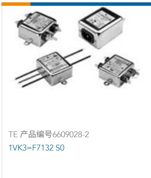
TE 产品编号6609028-2 1VK3=F7132 S0