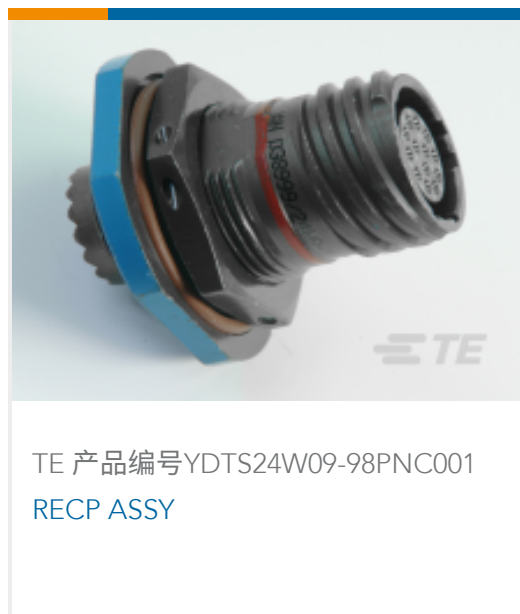
TE 产品编号YDTS24W09-98PNC001 RECP ASSY