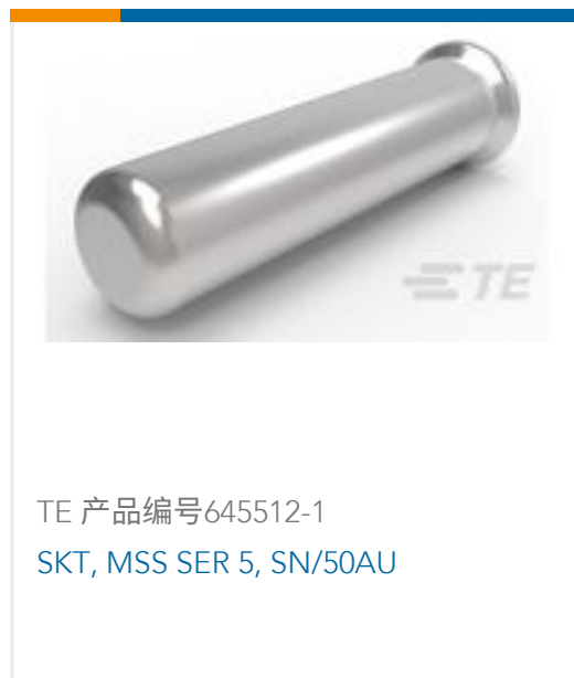
TE 产品编号645512-1 SKT, MSS SER 5, SN/50AU