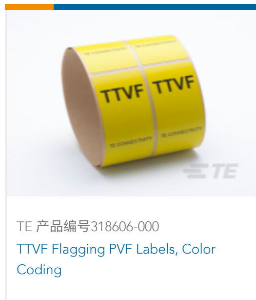
TE 产品编号318606-000 TTVF Flagging PVF Labels, Color Coding