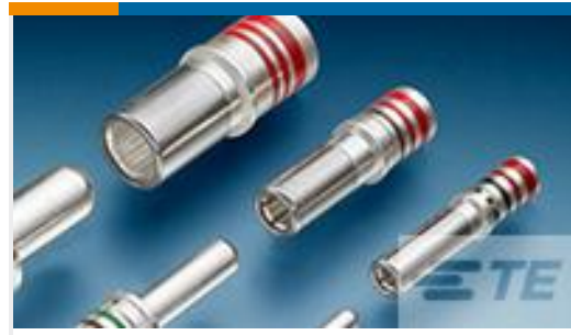
TE 产品编号0662-207-0082 CONT SOC ASSY