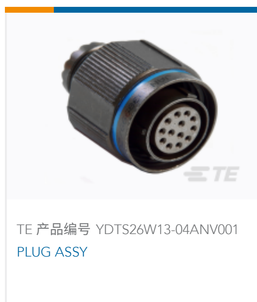
TE 产品编号 YDTS26W13-04ANV001 PLUG ASSY