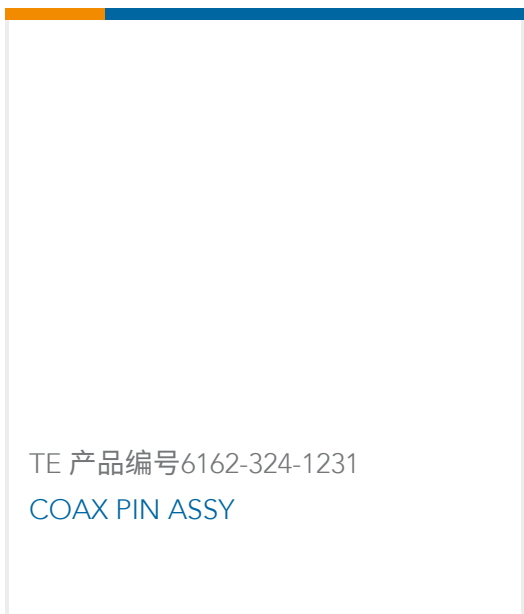
TE 产品编号6162-324-1231 COAX PIN ASSY