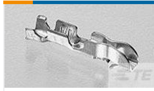
TE 产品编号170262-1 EIS CONTACT