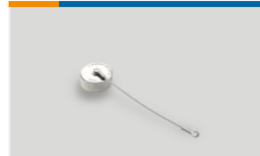
TE 产品编号YDTS33W09NV0010000 DUST COVER ASSEM