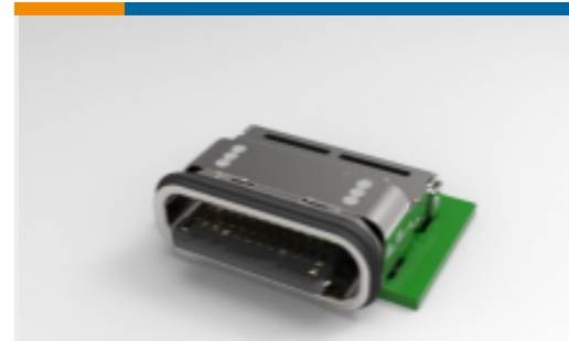
TE 产品编号2305018-2 USB TYPE C, REC IPX8 ON BOARD DUAL SMT