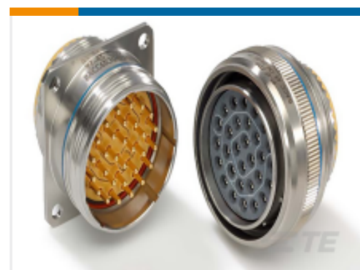
TE 产品编号ZPF0000000000007174 983-ORS 08-98 PN