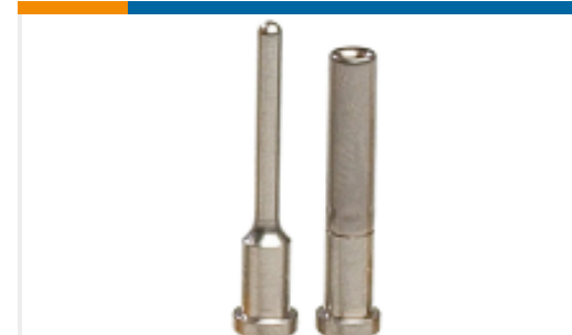
TE 产品编号ZPF0000000000001261 097-0267-16 A1267