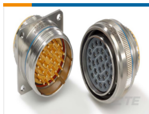
TE 产品编号ZPF00000000000007174 983-ORS 08-98 PN