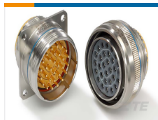
TE 产品编号ZPF00000000000007174 983-ORS 08-98 PN