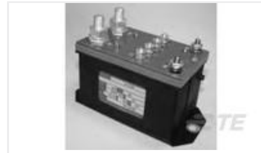
TE 产品编号1616058-6 A703CD (FAA/PMA)=RELAY