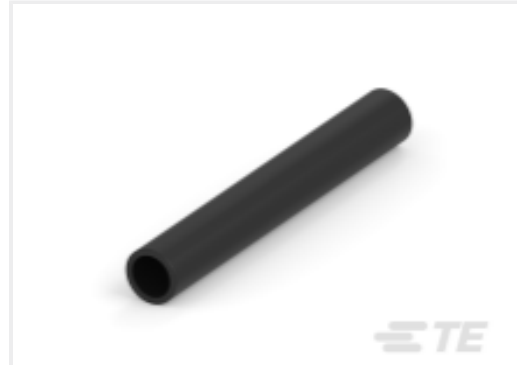
TE 产品编号CAT-HST-BSTS BSTS/BSTS-FR 热缩管