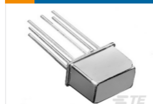
TE 产品编号1617147-5 JMGAP-26P = M39016/17-030P