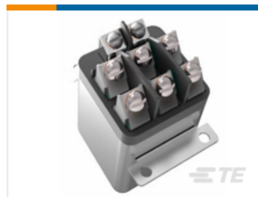
TE 产品编号1617807-5 FC-335-SY8= RELAY, 3PST