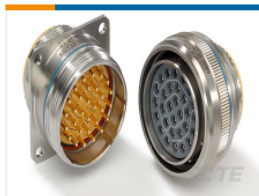
TE 产品编号ZPF0000000000007174 983-ORS 08-98 PN