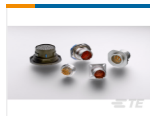
TE 产品编号YDTS20Y13-98XNV001 HERM RECP