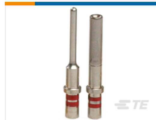
TE 产品编号ZPF0000000000001261 097-0267-16 A1267