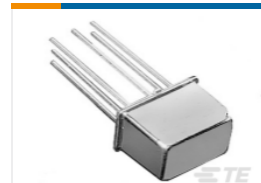
TE 产品编号1617147-5 JMGAP-26P = M39016/17-030P