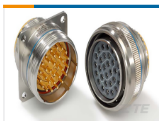
TE 产品编号ZPF00000000000007174 983-ORS 08-98 PN