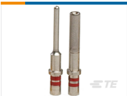
TE 产品编号ZPF000000000001261 097-0267-16 A1267