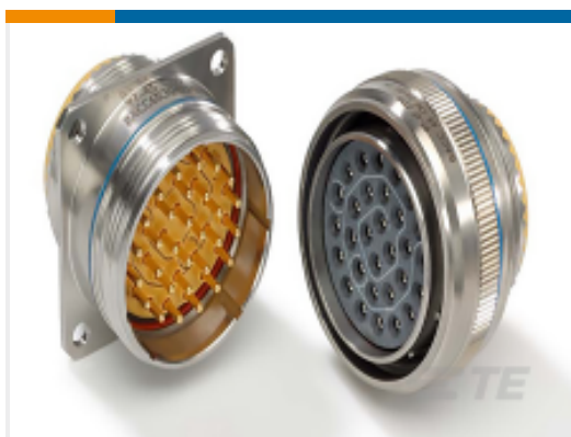
TE 产品编号ZPF0000000000007174 983-ORS 08-98 PN