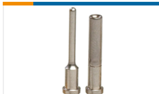
TE 产品编号ZPF0000000000001261 097-0267-16 A1267