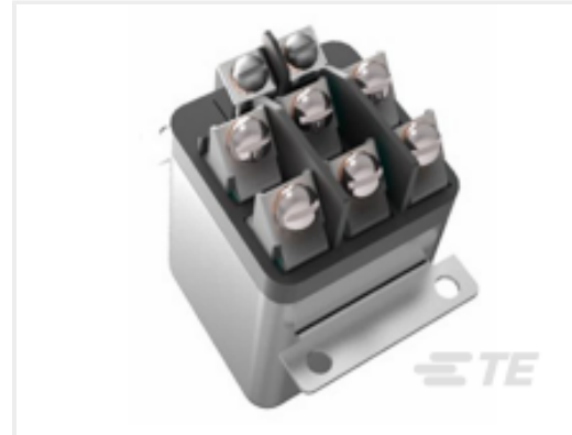
TE 产品编号1617807-5 FC-335-SY8= RELAY, 3PST