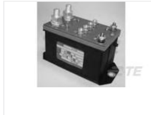
TE 产品编号1616058-6 A703CD (FAA/PMA)=RELAY