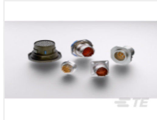
TE 产品编号YDTS20Y13-98XNV001 HERM RECP