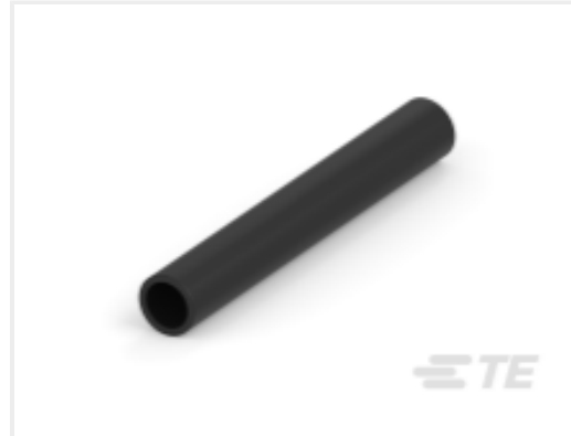
TE 产品编号CAT-HST-BSTS BSTS/BSTS-FR 热缩管