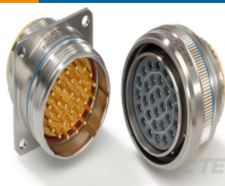
TE 产品编号358279-000 382C312-50-01-0