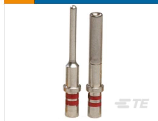
TE 产品编号ZPF000000000001261 097-0267-16 A1267