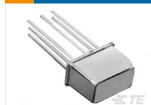
TE 产品编号1617147-5 JMGAP-26P = M39016/17-030P