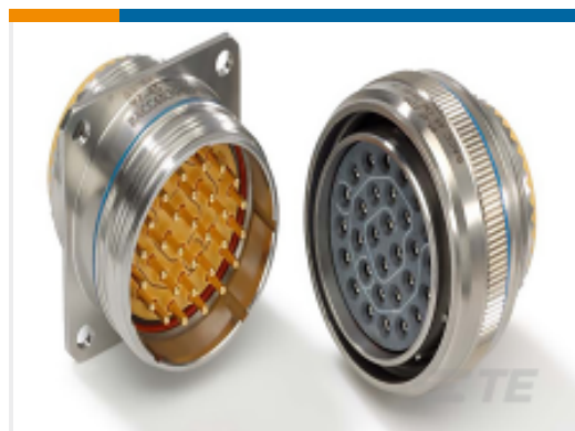
TE 产品编号ZPF00000000000007174 983-ORS 08-98 PN