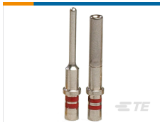
TE 产品编号ZPF0000000000001261 097-0267-16 A1267