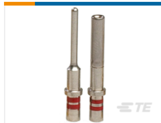
TE 产品编号ZPF0000000000001261 097-0267-16 A1267