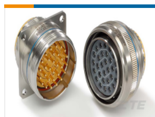
TE 产品编号ZPF00000000000007174 983-ORS 08-98 PN