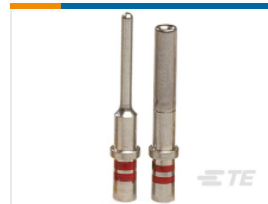
TE 产品编号ZPF0000000000001261 097-0267-16 A1267