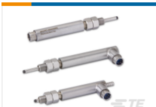
TE 产品编号032310060000-M 弹簧加压式 +10V LVDT