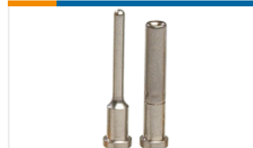
TE 产品编号ZPF000000000001261 097-0267-16 A1267