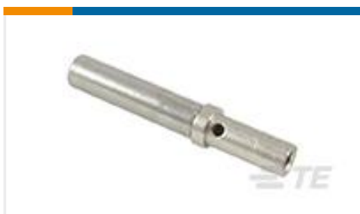
TE 产品编号0462-201-16141 SOC, SOLID, SIZE 16, 16-20AWG, NI