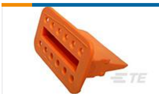
TE 产品编号W12S WEDGE LOCK, 12P, PLG, ORG, STD, DT