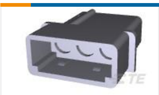
TE 产品编号1-480305-0 03P CMNL CAP HSG F/H NATL