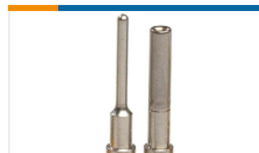
TE 产品编号 ZPF0000000000001261 097-0267-16 A1267