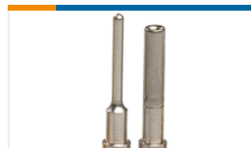
TE 产品编号ZPF0000000000001261 097-0267-16 A1267