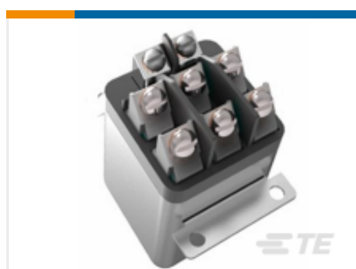
TE 产品编号1617807-5 FC-335-SY8= RELAY, 3PST