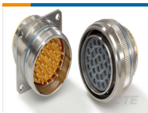
TE 产品编号ZPF00000000000007174 983-ORS 08-98 PN