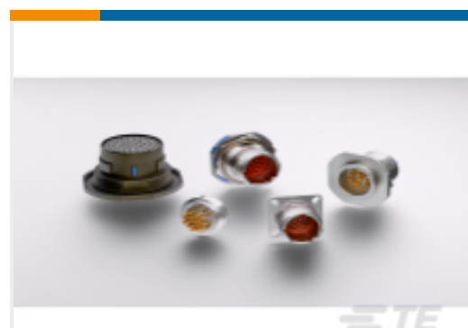
TE 产品编号YDTS20Y13-98XNV001 HERM RECP