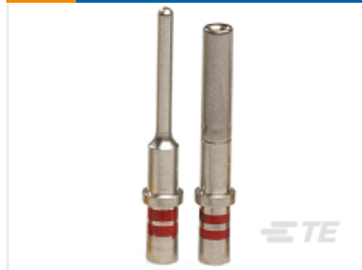
TE 产品编号ZPF0000000000001261 097-0267-16 A1267