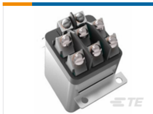
TE 产品编号1617807-5 FC-335-SY8= RELAY, 3PST