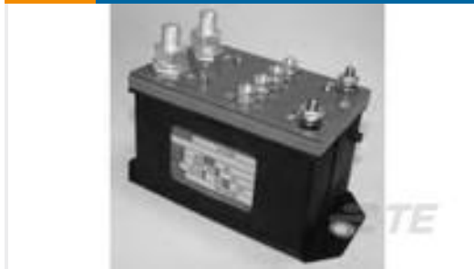
TE 产品编号1616058-6 A703CD (FAA/PMA)=RELAY