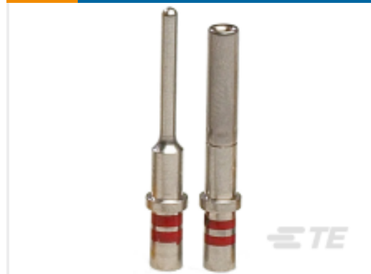
TE 产品编号ZPF0000000000001261 097-0267-16 A1267