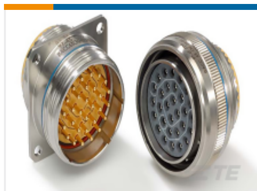
TE 产品编号ZPF00000000000007174 983-ORS 08-98 PN